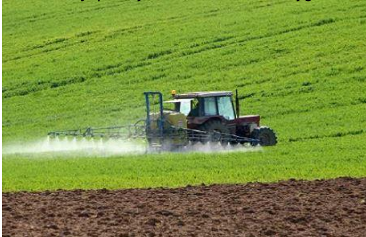
Bitki 3 – 5 yapraklıyken ilk Perla Vita C Uygulaması